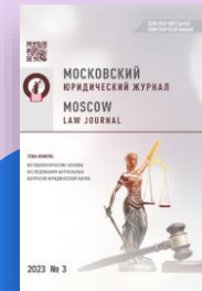
Московский юридический журнал