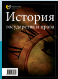
История государства и права

Результаты научно-исследовательской деятельности опубликованы, в частности, следующих журналах: