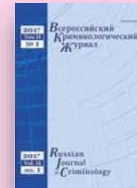
Всероссийский криминологический журнал