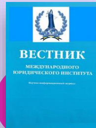
Вестник Международного юридического института