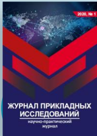
Журнал прикладных исследований

Результаты научно-исследовательской деятельности опубликованы в научных изданиях: